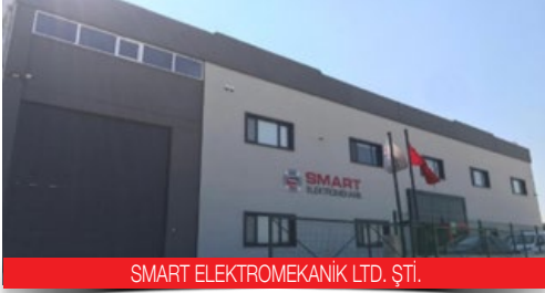
SMART ELEKTROMEKANİK LTD. ŞTİ.