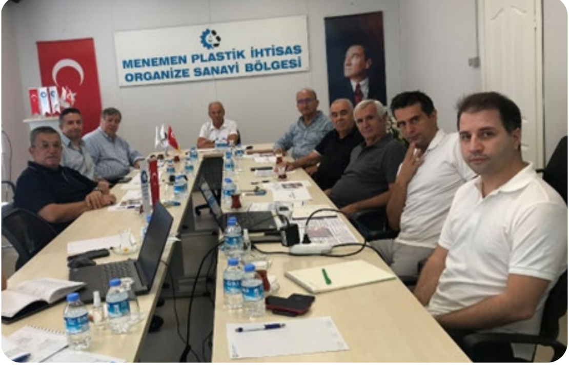
Yönetim Kurulu Toplantısı 11.06.2024

■ Nisan – Mayıs – Haziran dönemi Yönetim Kurulu toplantılarımız Denetim Kurulu Üyelerimizin de katılımı ile yapılmış olup, Bölgemiz gündeminde yer alan konular görüşülerek karara bağlanmıştır.