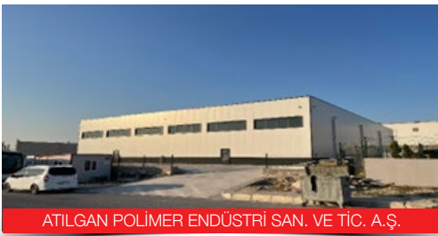
ATILGAN POLİMER ENDÜSTRİ SAN. VE TİC. A.Ş.