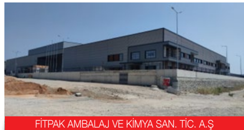
FİTPAK AMBALAJ VE KİMYA SAN. TİC. A.Ş.