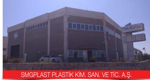
SMGPLAST PLASTİK KİM. SAN. VE TİC. A.Ş.