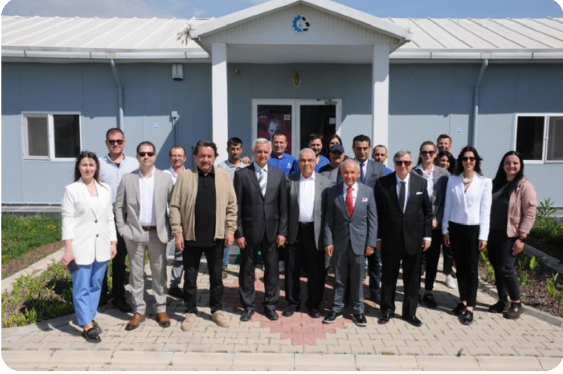
Ramazan Bayramı Kutlaması 04.04.2024