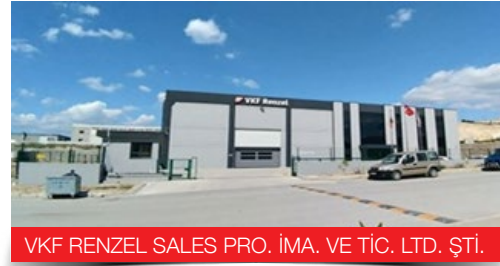
VKF RENZEL SALES PRO. İMA. VE TİC. LTD. ŞTİ.