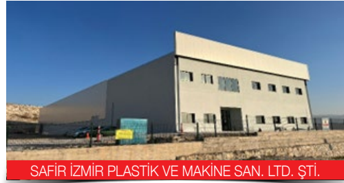
SAFİR İZMİR PLASTİK VE MAKİNE SAN. LTD. ŞTİ.