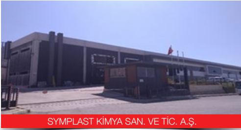
SYMPLAST KİMYA SAN. VE TİC. A.Ş.