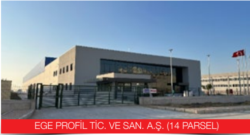
EGE PROFİL TİC. VE SAN. A.Ş. (14 PARSEL)