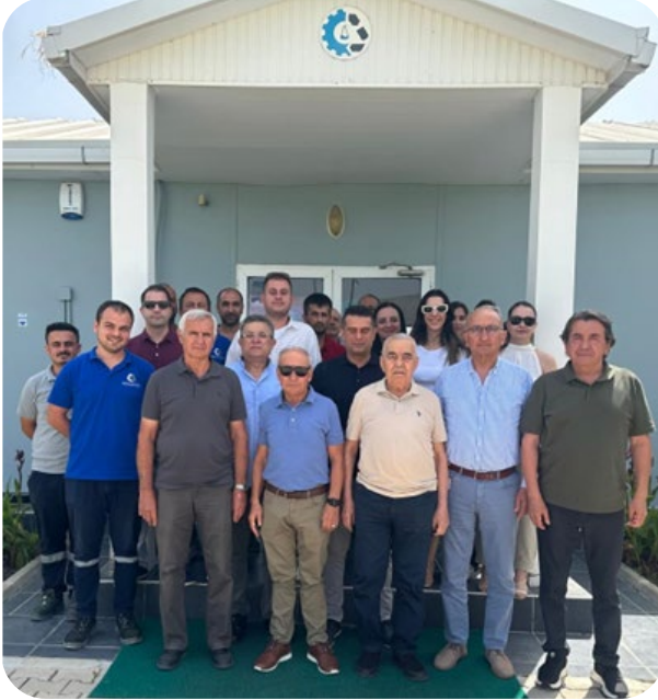
Kurban Bayramı Kutlaması 11.06.2024

■ Yönetim Kurulumuz ve Denetim Kurulumuzun da katılımları ile birlikte personellerimizle bayram kutlamaları yapılmıştır.