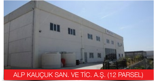
ALP KAUÇUK SAN. VE TİC. A.Ş. (12 PARSEL)