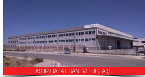
AŞ İP HALAT SAN. VE TİC. A.Ş.