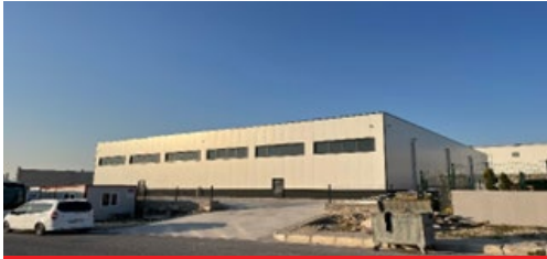
ATILGAN POLİMER ENDÜSTRİ SAN. VE TİC. A.Ş.