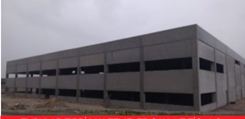
TURKLAB TIBBİ MALZEMELER SAN. VE TİC. A.Ş.