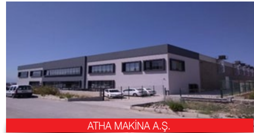
ATHA MAKİNA A.Ş.