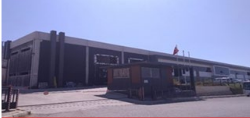
SYMPLAST KİMYA SAN. VE TİC. A.Ş.