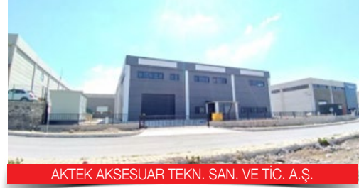
AKTEK AKSESUAR TEKN. SAN. VE TİC. A.Ş.