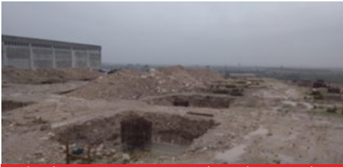
İMS İNŞAAT TUR. ULUS PAZ. HİZM. TİC. LTD. ŞTİ.