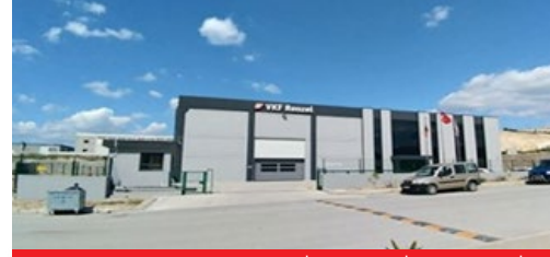
VKF RENZEL SALES PRO. İMA. VE TİC. LTD. ŞTİ.