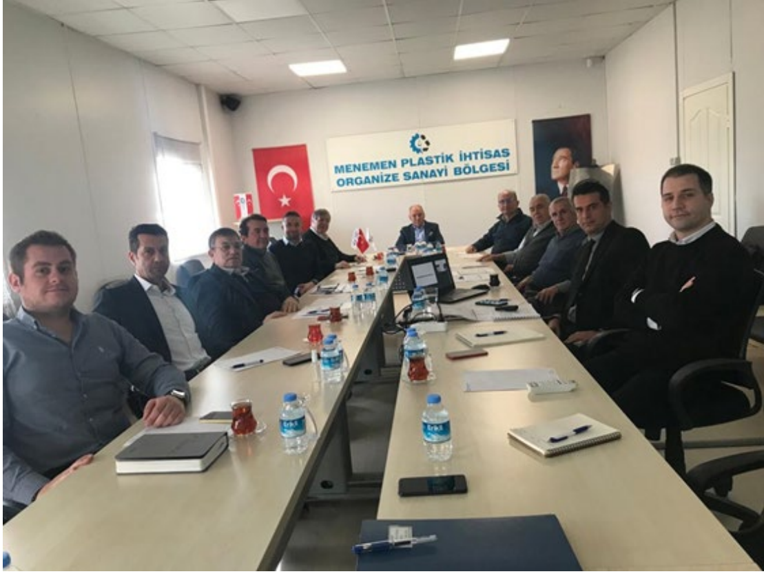
Yönetim Kurulu Toplantısı 19.12.2023

Ekim – Kasım - Aralık dönemi Yönetim Kurulu toplantılarımız Denetim Kurulu Üyelerimizin de katılımı ile yapılmış olup, Bölgemiz gündeminde yer alan konular görüşülerek karara bağlanmıştır.