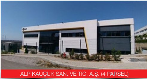
ALP KAUÇUK SAN. VE TİC. A.Ş. (4 PARSEL)