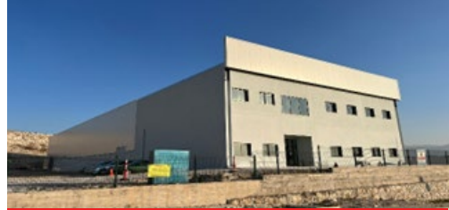
SAFİR İZMİR PLASTİK VE MAKİNE SAN. LTD. ŞTİ.