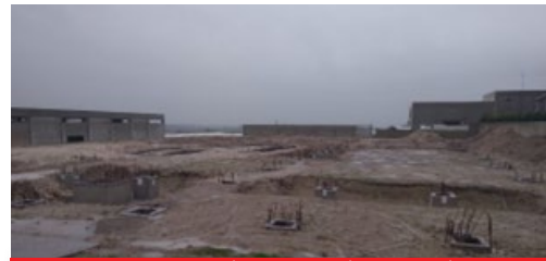
GÜVEN PLASTİK SAN. VE TİC. LTD. ŞTİ.