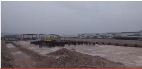
ATILGAN POLİMER ENDÜSTRİ SAN. VE TİC. A.Ş.