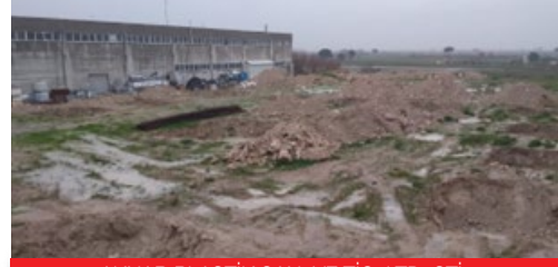
AKNAR PLASTİK SAN. VE TİC. LTD. ŞTİ.