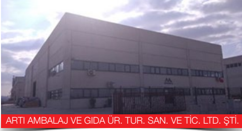
ARTI AMBALAJ VE GIDA ÜR. TUR. SAN. VE TİC. LTD. ŞTİ.