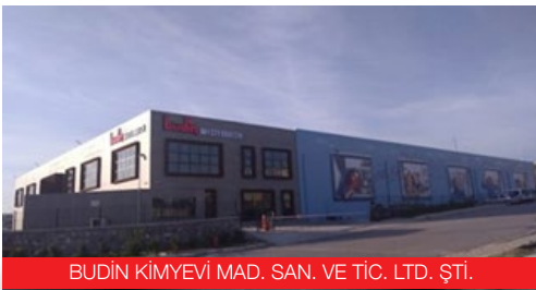
BUDİN KİMYEVİ MAD. SAN. VE TİC. LTD. ŞTİ.