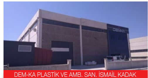
DEM-KA PLASTİK VE AMB. SAN. İSMAİL KADAK