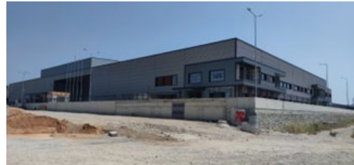
FİTPAK AMBALAJ VE KİMYA SAN. TİC. A.Ş.