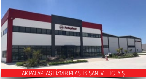
AK PALAPLAST İZMİR PLASTİK SAN. VE TİC. A.Ş.