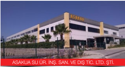
ASAKUA SU ÜR. İNŞ. SAN. VE DİŞ TİC. LTD. ŞTİ.