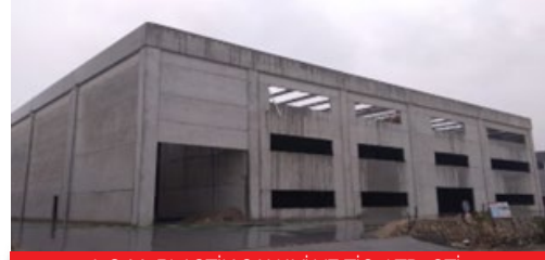
A.G.M. PLASTİK SANAYİ VE TİC. LTD. ŞTİ.