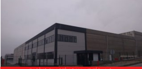
PAPİKS PLASTİK SAN. VE TİC. A.Ş.