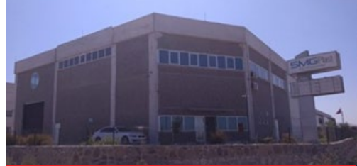
SMGPLAST PLASTİK KİM. SAN. VE TİC. A.Ş.