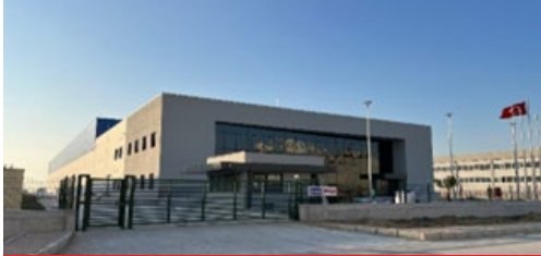
EGE PROFİL TİC. VE SAN. A.Ş. (14 PARSEL)