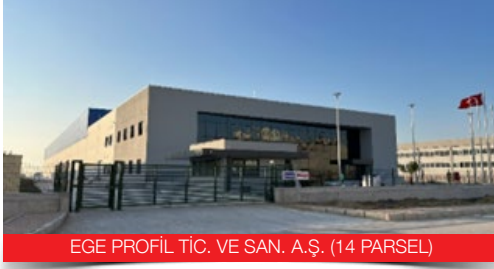
EGE PROFİL TİC. VE SAN. A.Ş. (14 PARSEL)