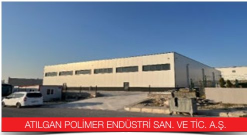
ATILGAN POLİMER ENDÜSTRİ SAN. VE TİC. A.Ş.