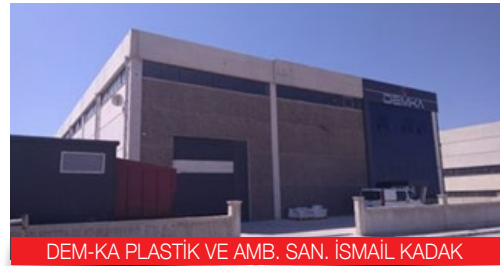
DEM-KA PLASTİK VE AMB. SAN. İSMAİL KADAK