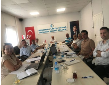
Yönetim Kurulu Toplantısı 25.07.2023