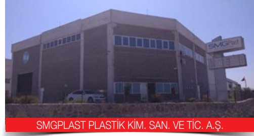
SMGPLAST PLASTİK KİM. SAN. VE TİC. A.Ş.