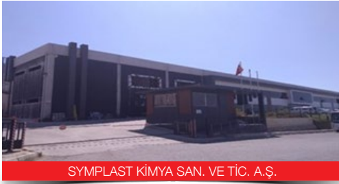
SYMPLAST KİMYA SAN. VE TİC. A.Ş.