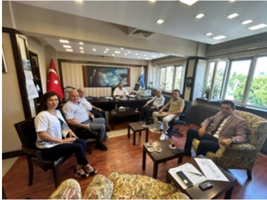
11.07.2023 TEİAŞ Ziyareti