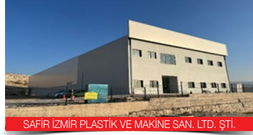
SAFİR İZMİR PLASTİK VE MAKİNE SAN. LTD. ŞTİ.