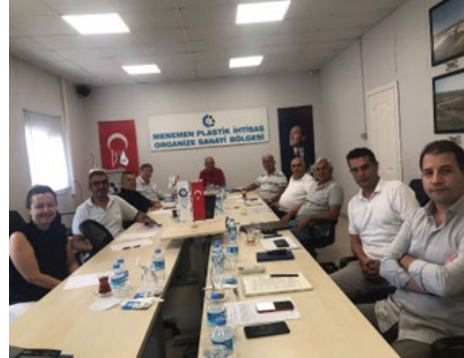
Yönetim Kurulu Toplantısı 17.08.2023