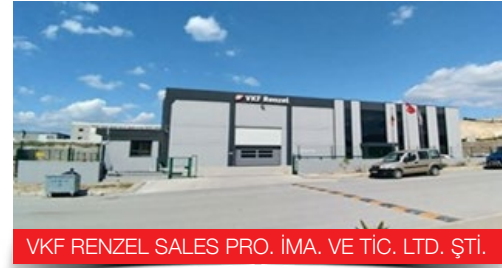
VKF RENZEL SALES PRO. İMA. VE TİC. LTD. ŞTİ.