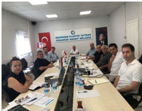
Yönetim Kurulu Toplantısı 19.09.2023

Temmuz - Ağustos - Eylül dönemi Yönetim Kurulu toplantılarımız Denetim Kurulu Üyelerimizin de katılımı ile yapılmış olup, Bölgemiz gündeminde yer alan konular görüşülerek karara bağlanmıştır.