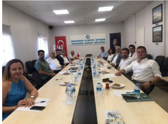
01.08.2023 TEİAŞ ve GEDİZ Bölge Ziyareti