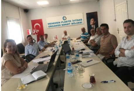
Yönetim Kurulu Toplantısı 25.07.2023