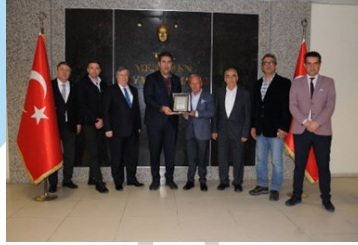
Menemen Kaymakamlığı 11.04.2023