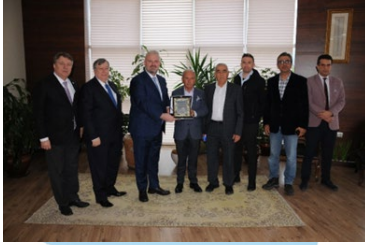
Menemen Belediyesi 11.04.2023