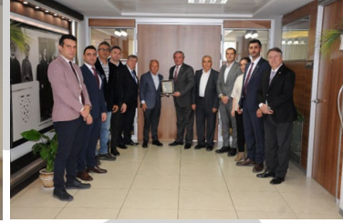
Menemen Ticaret Odası 11.04.2023