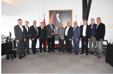
Ege Bölgesi Sanayi Odası 17.04.2023