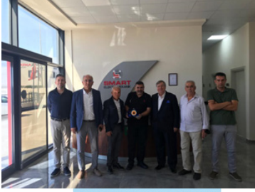
SMART ELEKTROMEKANİK MEKATRONİK MÜH. SAN. VE TİC. LTD. ŞTİ.