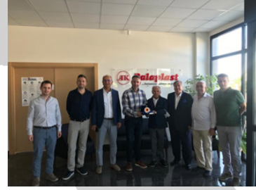
AK PALAPLAST İZMİR PLASTİK SAN. VE TİC. A.Ş.

Üretime geçen firmalarımıza ziyaretlerimiz devam etmektedir.