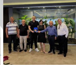
Asakua Su Ür. İnş. San. Ve Dış Tic. Ltd. Şti.