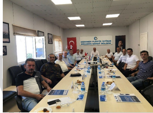
Müşteşebbis Heyet Toplantısı 27.07.2022

Temmuz – Ağustos - Eylül dönemlerinde Müşteşebbis Heyet ve Yönetim Kurulu Toplantılarımız Yapılmıştır.