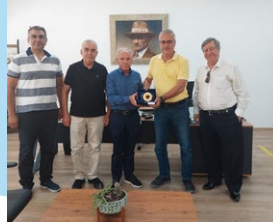
Alp Kauçuk San. Ve Tic. A.Ş.