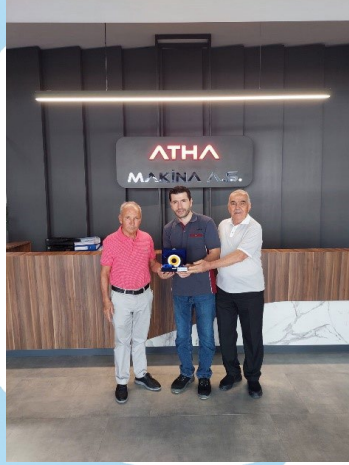
Atha Makina A.Ş.