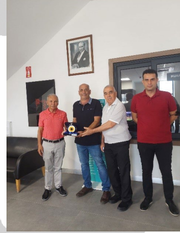
Vkf Renzel Sales Pro. İmalat Ve Tic. Ltd. Şti.