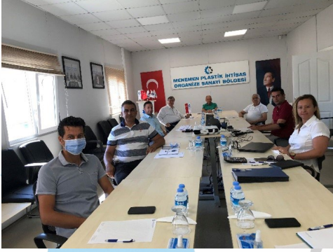
Yönetim Kurulu Toplantısı 19.07.2022