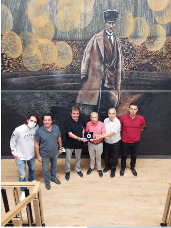
Budin Kimyevi Maddeler San. Ve Tic. Ltd. Şti.

Pandemiden önce başladığımız ancak pandemi sebebiyle uzun zaman ara verdiğimiz firma ziyaretlerimize tekrar başlanmıştır. » Tıklayınız. (Link 8)