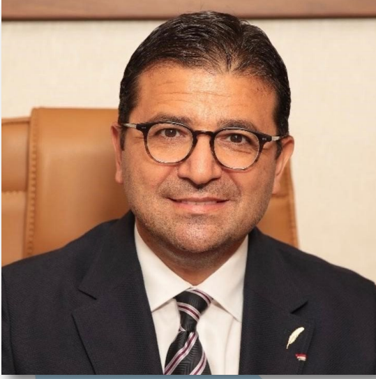
Av. ERDAL KARDAŐ MPIO SB Hukuk DanıŐmanı

Anonim Őirketin zorunlu ve en önemli organı Genel Kuruldur. Önemli kararların alındığı Genel Kurullar tek ortaklı Őirketler veya yakın aile fertlerinden oluŐan Őirketler için formalite niteliğinde gibi görünse de çok ortaklı Őirketlerde bazı hususlara dikkat edilmezse her bir Genel Kurul ciddi bir tartıŐma ortamı, ortaklar arasında gerilim nedeni ve dava konusu bile olabilir.