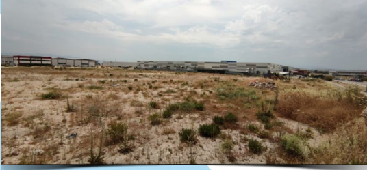
5535 Ada – 2 Parsel Temizlik Öncesi

Son dönemdeki idari ve teknik faaliyetlerimiz için. » Tıklayınız. (Link 8)