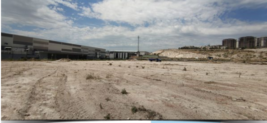
5535 Ada – 2 Parsel Temizlik Sonrası