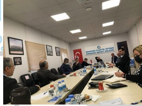
Yönetim Kurulu Toplantısı 08.02.2022