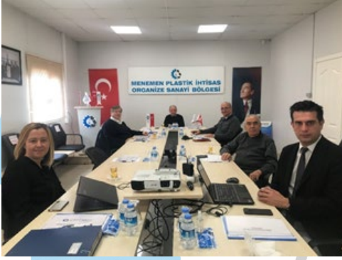
Yönetim Kurulu Toplantısı 25.01.2022