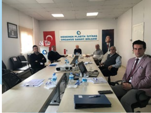
Yönetim Kurulu Toplantısı 22.02.2022