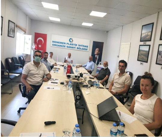
Yönetim Kurulu Toplantısı 11.08.2021