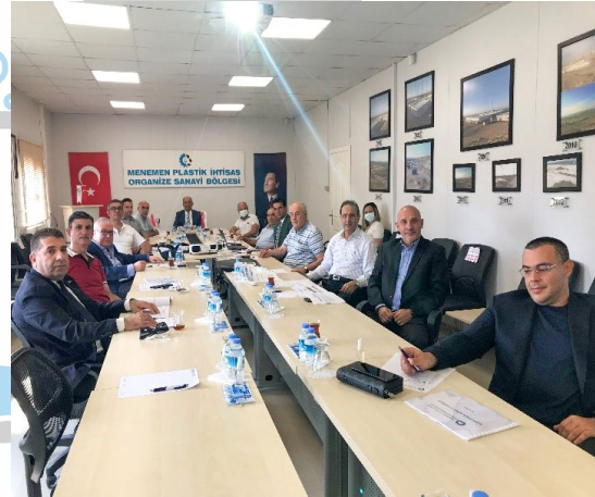
Müteşebbis Heyet ve Yönetim Kurulu Toplantısı 14.09.2021