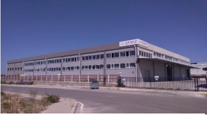
AS İP HALAT SAN. VE TİC. A.Ş.