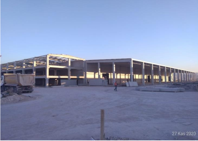
ESEN PLASTİK SAN. VE TİC. A.Ş. (12 PARSEL)