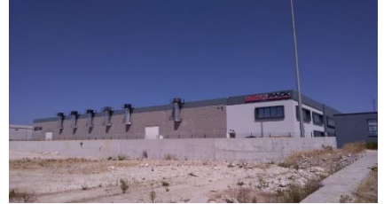
ATHA MAKİNA A.Ş.