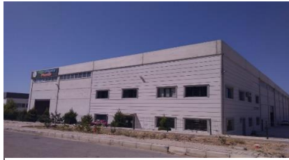
EGE DAMLA PLASTİK MEHMET SALİH DAKAK