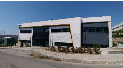
ALP KAUCUK SAN. VE TİC. A.Ş.