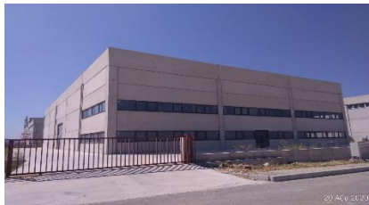
İNTERYAĞ PETROL ÜRÜNLERİ SAN. TİC. LTD. ŞTİ.