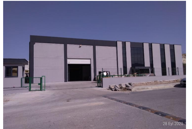
VKF RENZEL SALES PRO. İMA. VE TİC. LTD. ŞTİ.