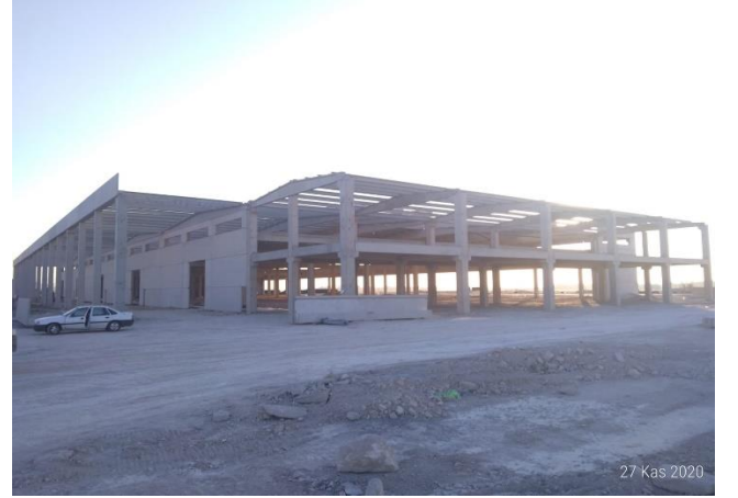
ESEN PLASTİK SAN. VE TİC. A.Ş. (15 PARSEL)