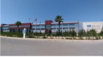
EGE PROFİL TİC. VE SAN. A.Ş.