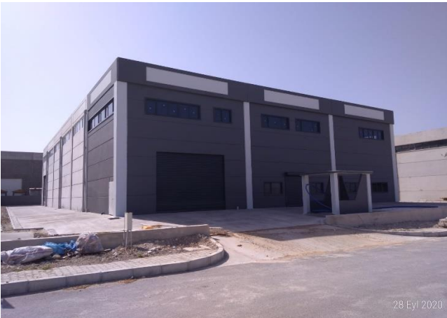
PLSMK PLASTİK AMB. VE MAK. İMALAT SAN. TİC. LTD. ŞTİ.A.Ş.