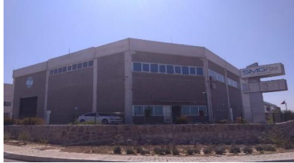
SMGPLAST PLAS. KİM. SAN. VE TİC. A.Ş.