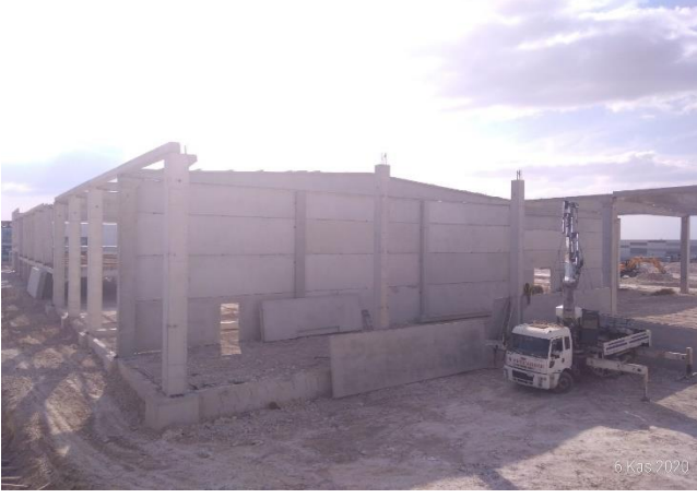
BUDİN KİMYEVİ MADDELER SAN. VE TİC. LTD. ŞTİ.