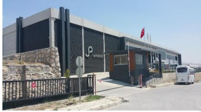
SYPLAST KİMYA SAN. VE TİC. A.Ş.