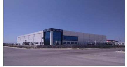
GÜRDEMİR PLASTİK BASKI AMB. SAN. VE TİC. LTD. ŞTİ.