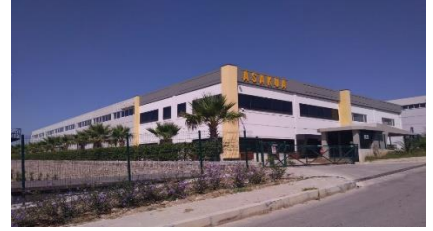
ASAKUA SU ÜR. İNŞ. SAN. VE DİŞ TİC. LTD. ŞTİ.