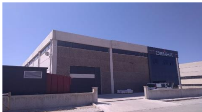
DEM-KA PLASTİK VE AMB. SANAYİ İSMAİL KADAK