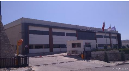
EGESEMBOL PLASTİK SAN. VE TİC. LTD. ŞTİ.