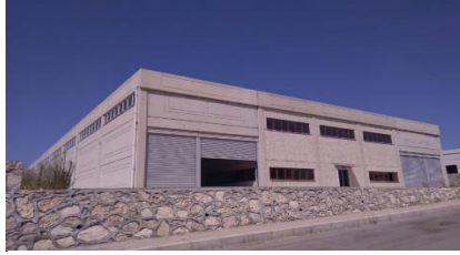
MEDUSA PLASTİK KOMP. İNŞ. SAN. VE TİC. LTD. ŞTİ.