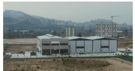
AK PALAPLAST İZMİR PLASTİK SAN. VE TİC. A.Ş.