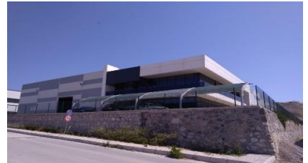
GÖKTOĞAN TEKNİK MAK. MOD. SAN. VE TİC. LTD. ŞTİ.ŞTİ.