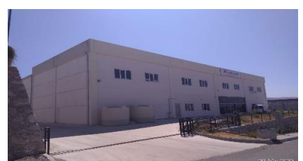
METE ENERJİ KABLO VE ELK. MALZ. SAN. VE TİC. A.Ş.