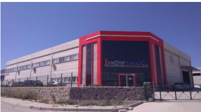
İNOVPACK MAK. AMB. SAN. VE TİC. A.Ş.