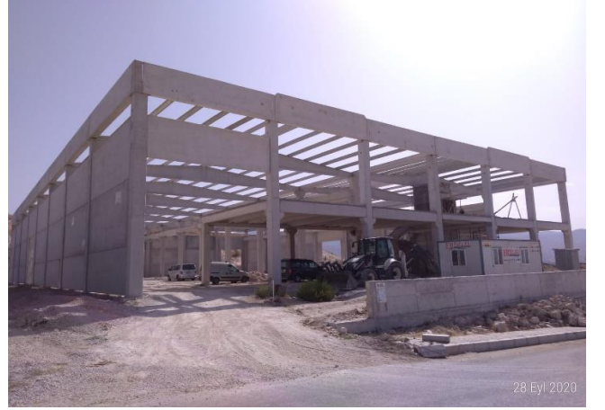
İZ MEKANİK MAK. KONS. DÖK. SAN. VE TİC. A.Ş.