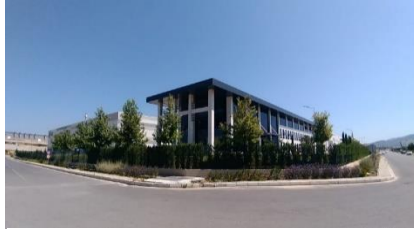
KASTAŞ SIZ. TEK. SAN. VE TİC. A.Ş.